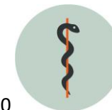
Tabel 2a fortsat